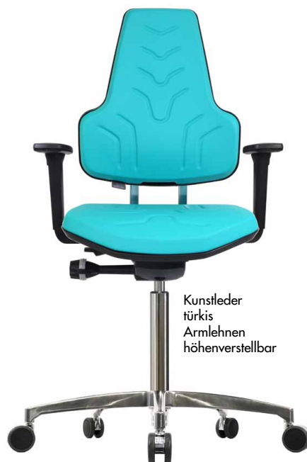
Kunstleder türkis Armlehnen höhenverstellbar